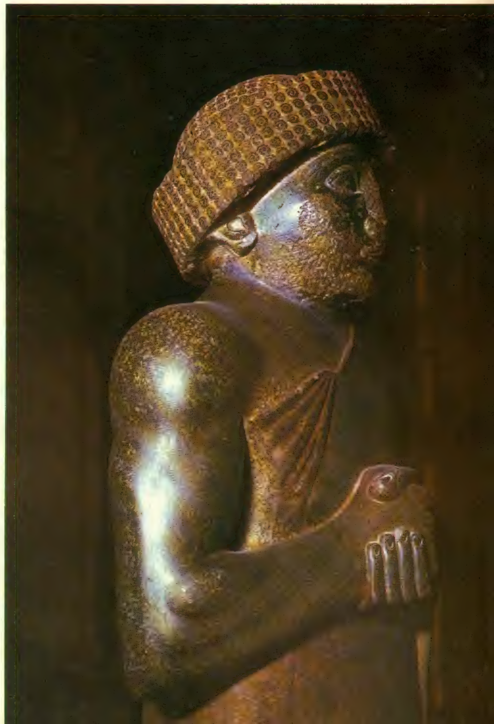
Estatua de Gudea, rey de Lagash (Museo del Louvre, París).